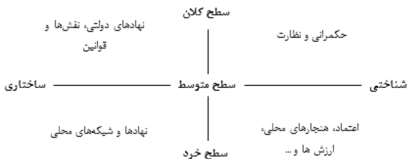
شکل ۱. اشکال و قلمرو سرمایه اجتماعی (Basile and Cecchi, 2007: 4)

سرمایه اجتماعی در سطوح مختلف عملکردی شامل سطح خرد (ناظر بر رفتار شبکه‌هایی از افراد و خانواده‌ها)، سطح میانی (پیوندها و روابط عمودی) و سطح کلان (رسمی ترین روابط و ساختارهای نهادی) مدنظر است و می‌تواند با ایجاد تحولات شناختی و ساختاری که مکمل یکدیگر هستند، به عنوان یک کالای عمومی، ارتباط متقابلی با توسعه داشته باشد (ساروخانی، ۱۳۸۷: ۴۳). در واقع اشکال ساختاری سرمایه اجتماعی بر روابط بین انسان و نهادها تأکید می‌کند و مواردی از قبیل قوانین، شبکه‌های اجتماعی، انجمن‌ها، نهادها، نقش‌ها و رویه‌ها را در بر می‌گیرد که با حکمرانی و نظارت، ارزش‌ها، اعتماد، هنجارها و ... که بیشتر جنبه شناختی دارند (شکل ۱)، تکمیل می‌شوند (Krishna and Nor-man, 1999: 174).