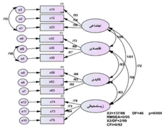
شکل ۳. ارزیابی اثرات اقدامات عمرانی انجام شده در کاهش مهاجرت با استفاده از مدل تحلیل عاملی تأییدی اصلاح شده

در مدل تحلیل عاملی تأییدی اصلاح‌شده، اثرات ابعاد مختلف اجتماعی، اقتصادی، کالبدی و زیست‌محیطی اقدامات عمرانی بر یکدیگر و تأثیر آنها بر کاهش مهاجرت در سطح روستاها مورد مطالعه قرار گرفته است. مقادیر برآورده شده برای پارامترهای آزاد در حالت استاندارد نشان می‌دهد که بیشترین ضریب همبستگی بین ابعاد مختلف اجتماعی، اقتصادی، کالبدی و زیست‌محیطی بین دو متغیر اجتماعی و اقتصادی با ضریب ۱/۰۶ درصد می‌باشد. در رتبه بعدی ضریب همبستگی بین متغیرهای اجتماعی و کالبدی با مقدار ۱/۰۱ درصد به دست آمده است. ابعاد اقتصادی و کالبدی دارای ضریب همبستگی ۰/۹۳ و ابعاد کالبدی و زیست‌محیطی دارای همبستگی ۰/۶۳ می‌باشند. ابعاد اقتصادی و زیست‌محیطی همبستگی ۰/۵۹ و ابعاد اجتماعی و زیست‌محیطی دارای ضریب همبستگی ۰/۷۲ هستند. کمترین ضریب همبستگی بین دو متغیر اقتصادی و زیست‌محیطی با ضریب همبستگی ۰/۵۹ مشاهده می‌شود. به‌منظور چگونگی برآزش مدل پژوهش با داده‌های نظری نیز در جدول (۱۰)، به اکتفای مهم‌ترین شاخص‌های برآزش به مقایسه مقادیر تجربی مدل با مقادیر معیار پیشنهادی می‌پردازیم.