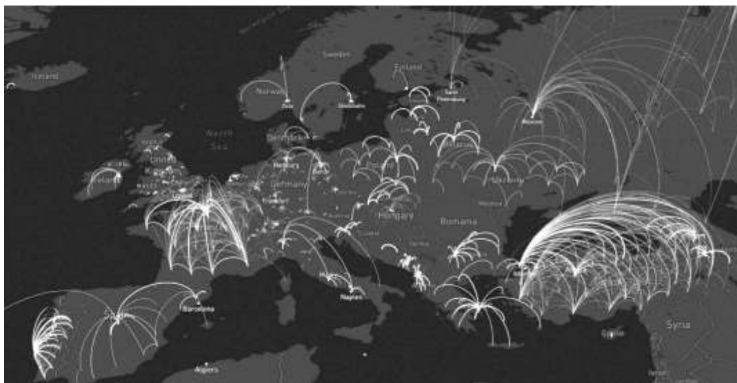
شکل ۱. جدیدترین جریان‌های فضایی شبکه‌های شهری مبتنی بر مهاجرت در ۳۸ کشور اروپایی

«اصطلاح سیستم شهری اولین بار توسط برایان بری در سال ۱۹۶۴ به کار گرفته شد. منظور وی از نظام شهری: گروهی از شهرهای وابسته و مرتبط به هم یعنی همان مفهوم شبکه‌ی شهری» (تقوایی: ۱۳۸۹: ۵۷). «در جغرافیای شهری، شبکه را مترادف با توزیع و پراکندگی می‌دانند و بر توزیع مکانی شهر در محدوده‌ی جغرافیایی ناحیه و کشور می‌اندیشند، بدون این‌که بر طبقه‌بندی شهرها توجهی داشته باشند ولی عملاً دیده می‌شود که شهرها یک اندازه و یک شکل نیستند و در رابطه با نقش‌های متفاوتی که دارند بر روستاها و مناطق پیرامونی خود اثر می‌گذارند. شبکه‌ی شهری به مجموعه‌ای از شهرها گفته می‌شود که از فضای جغرافیایی ناحیه‌ها مانند حلقه‌های زنجیره‌ای به هم پیوسته، شکل گرفته‌اند و به علت رشد ناهماهنگ، پرتوافشانی متفاوتی روی ناحیه دارند» (فرید، ۱۳۸۲: ۴۸۶). مطالعه‌ی شبکه شهری به عنوان «گروهی از شهرهای وابسته و مرتبط با یکدیگر» در طول قرن بیستم از اهمیت ویژه‌ای در برنامه‌ریزی ملی و منطقه‌ای برخوردار بوده است. به‌درستی معلوم نیست که واژه‌ی «شبکه شهری» از چه زمانی و چگونه وارد ادبیات برنامه‌ریزی در ایران شده است. این واژه برگردانی از واژه فرانسوی «Armature Urban» می‌باشد که به ویژه در مباحث آمایش سرزمین در آن کشور به طور گسترده کاربرد داشته است.